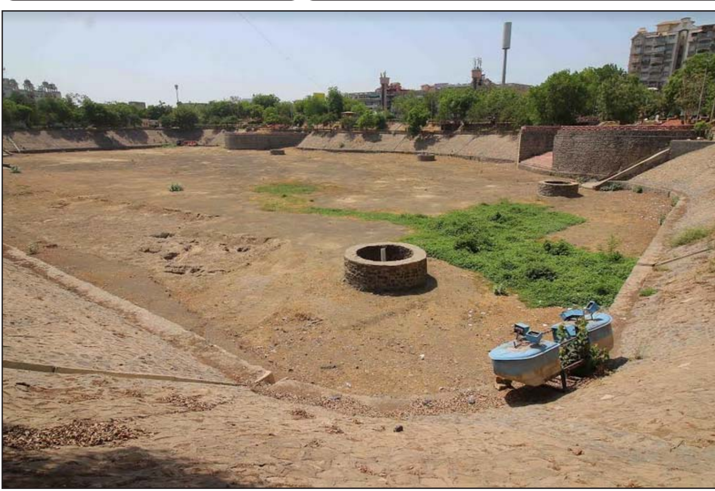
અમદાવાદ શહેરના વસ્ત્રાપુર લેક સુકાઈ જવાના કારણે બહાર રહેલા ફુવારામાં પણ પાણી નથી.

ચૂંટણીપંચ દ્વારા ચાર કરોડ રૂપિયાના ઇવીએમ-વીવીપેટના કાયમી સંગ્રહ